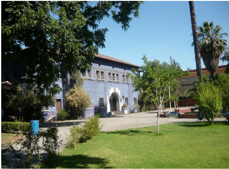
Vista entrada principal UMCE

La dirección es Avenida José Pedro Alessandri 774, Ñuñoa, ex Macul, que es una cuadra al norte de la intersección de esa calle con Avenida Grecia.